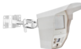
Compatible avec la rotule MBW110