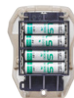
4 piles LS14500 4 ans d'autonomie